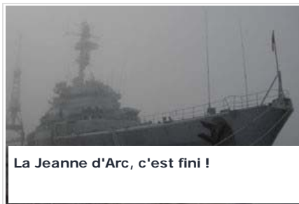
La Jeanne d'Arc, c'est fini !